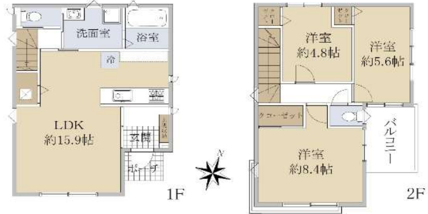
【概略図により現況を優先します】